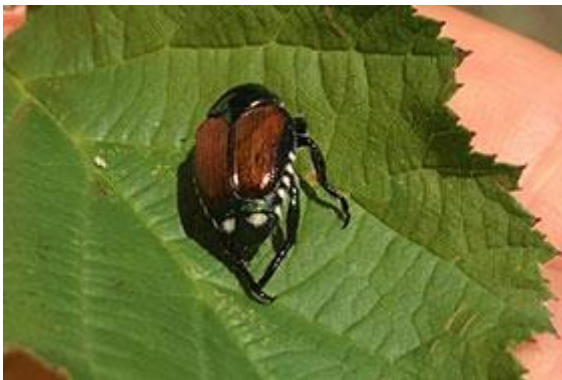
Abb. 1 - Japankäfer - Erstfund in der Schweiz aus einer Pheromonfalle in Stabio 2017.

Der eigentlich in Asien beheimatete Japankäfer nimmt Kurs auf die Schweiz. Die invasive Art konnte sich in der Nähe von Mailand bereits etablieren. Seitens der Schweiz wird alles unternommen, um eine "Einreise" zu verhindern. 2017 wurden erstmals Käfer in vorsorglich an der Grenze zu Italien aufgehängten Fallen gefangen. Wie sieht diese invasive Art aus, welche Wirtspflanzen bevorzugt sie und welche Massnahmen können ergriffen werden?