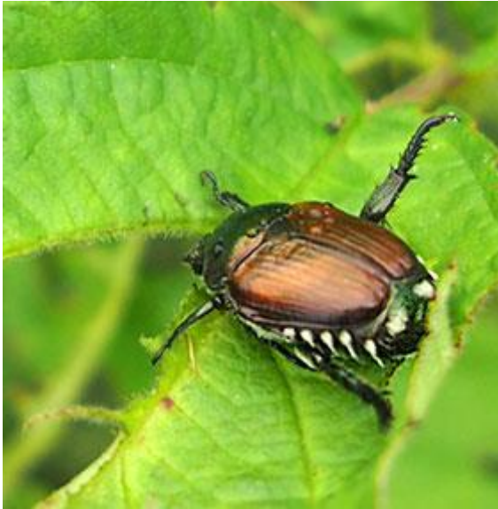
Abb. 3 - Typische Alarmverhalten der Käfer mit abgespreizten Beinen.