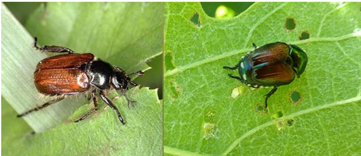
Abb. 6 - Einheimischer Gartenlaubkäfer ( Phyllopertha horticola ) links, Japankäfer (rechts).

Es besteht die Möglichkeit, dass der Japankäfer mit einheimischen Käfern verwechselt wird - am häufigsten mit dem Juni- oder Gartenlaubkäfer ( Phyllopertha horticola ). Er besitzt aber keine weissen Haarbüschel!