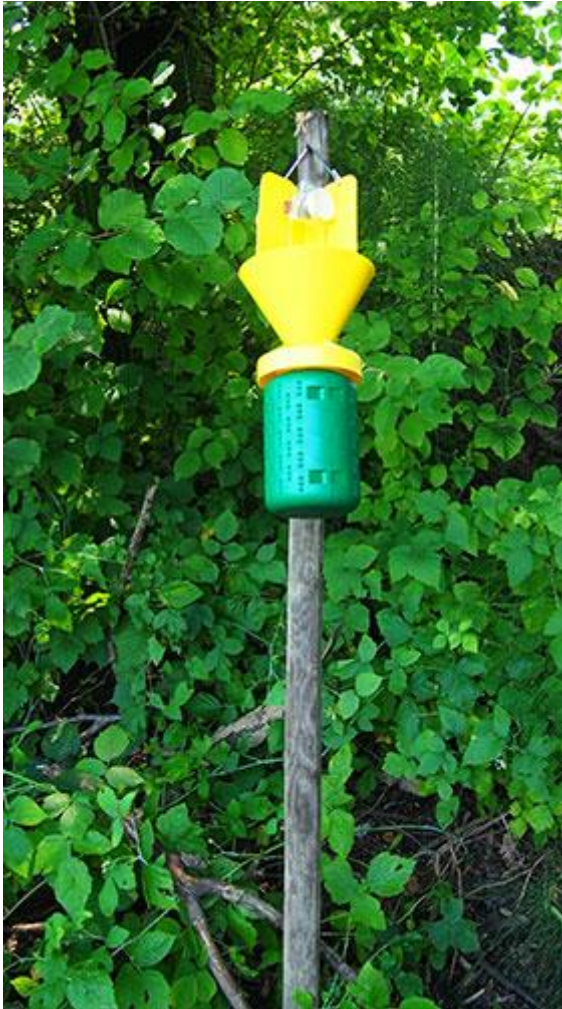
Abb. 5 - Pheromonfalle, aufgestellt an der Schweizer Grenze zu Italien.