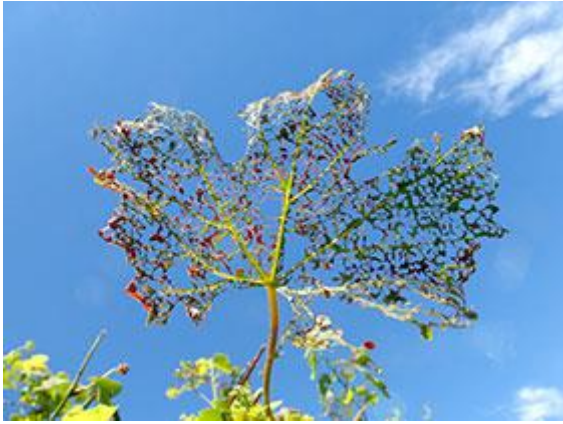
Abb. 4 - Völlig zerfressenes Blatt durch die Japankäfer.

Zu den Wirtspflanzen des Japankäfers zählen über 300 Pflanzenarten.